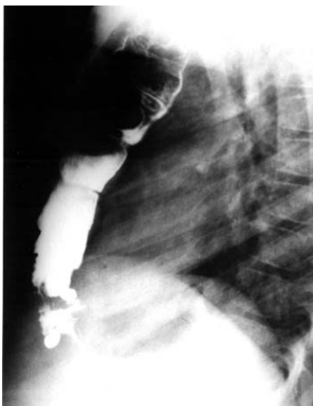
Предна (ретростернална) колоезофагопластика

което ние я определят като метод на избор при доносени деца, в много добро общо състояние без придружаващи аномалии и развили се хронични белодробни възпалителни процеси /фиг. 4 и 5/.